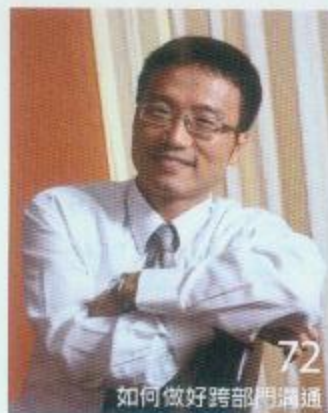
72 如何做好跨部門溝通