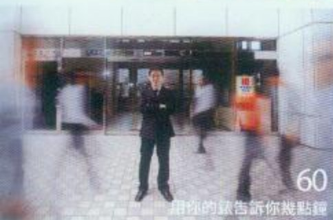
60 用你的錶告訴你幾點鐘