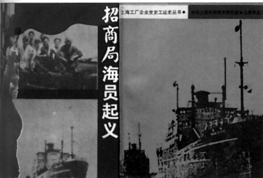
“航海档案”豆功亚与海员起义史 - 见第25页