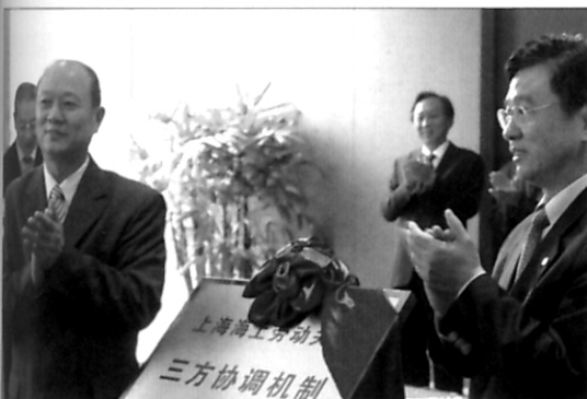
“文化博览”中国海员大会，聚焦海员素质与权益保护 - 见第38页