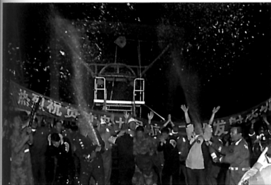
“风采”东海救助局“神舟九号”海上应急救援保障纪实 - 见第40页