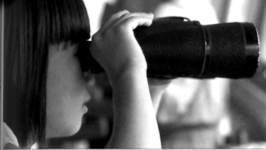
“约见航海界”为“航海日”鸣笛 为航运中心喝彩 - 见第6页