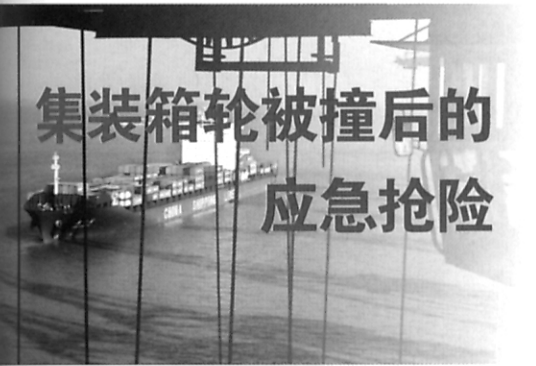
“航海技术”集装箱轮被撞后的应急抢险 - 见第50页