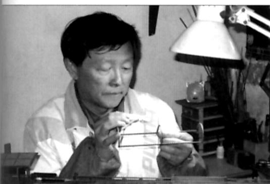
“文化博览” 我做《清明上河图》中的古船 - 见第 44 页