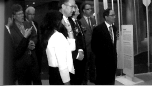
“约见航海界” 航路 1600——四百年中荷航海交往史 - 见第 6 页