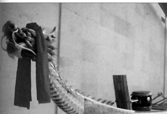
“文化博览” 龙舟竞渡的历史渊源及现实意义刍议 - 见第 40 页