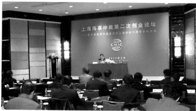
业界看点 十年磨剑露锋芒 二次创业论变革 ——上海海事仲裁二次创业论坛侧记