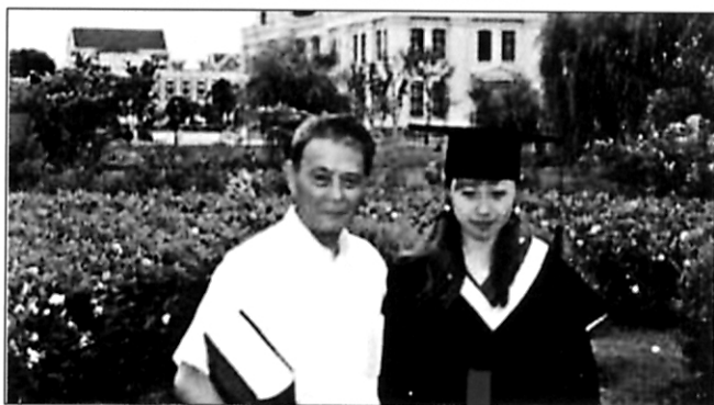
航海档案 我的热工节能生涯