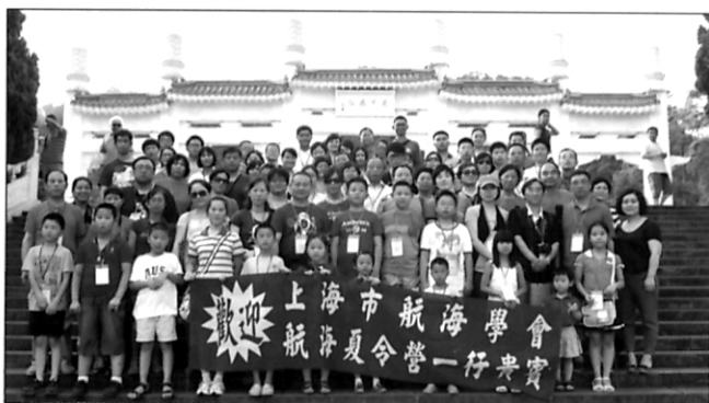
约见航海界 寻访近代船政史 直航台湾跨海峡——上海市航海学会成功举办 2013 年青少年航海夏令营活动