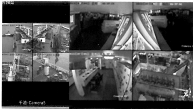
航海技术 船舶视频监控系统介绍

社长: 陈纪鸿 PROPIETER: CHEN JI HONG 主编: 桑史良 CHIEF EDITOR: SANG SHILIANG 021-65439837