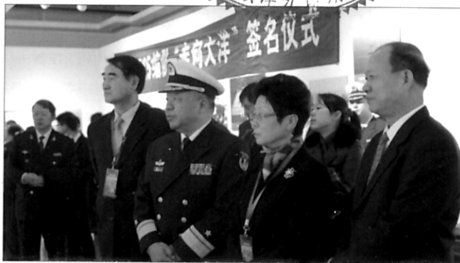
约见航海界 “中国海军亚丁湾护航五周年纪念” 特别展开幕