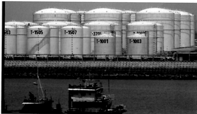
约见航海界 创业六十六年添新彩 助力“海上丝路”鼓征帆——上海海运投建福州最大化工仓储企业运营