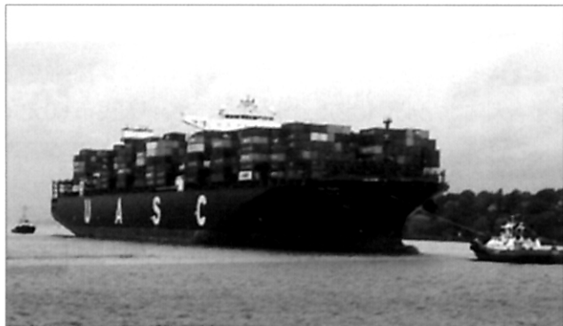
航海技术 “中海环球”轮首航汉堡港安全简述