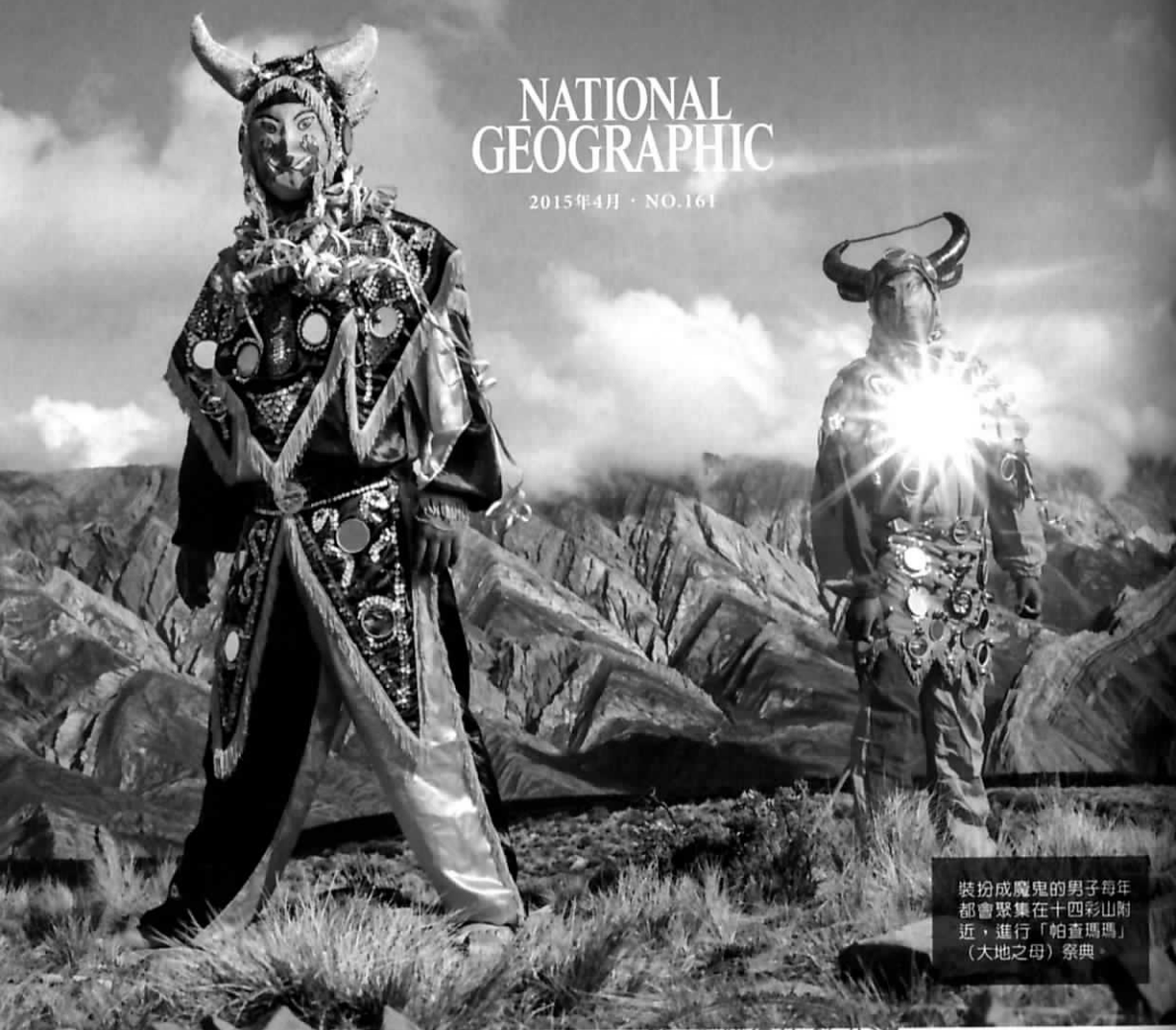
裝扮成魔鬼的男子每年都會聚集在十四彩山附近，進行「帕查瑪瑪」（大地之母）祭典。