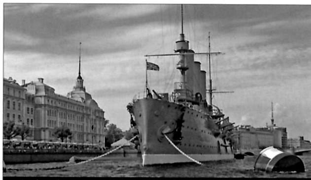
文化博览 俄罗斯海军军官的摇篮——纳西莫夫海军学校