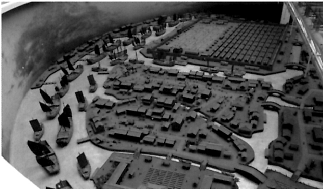
文化博览 港与市的交融