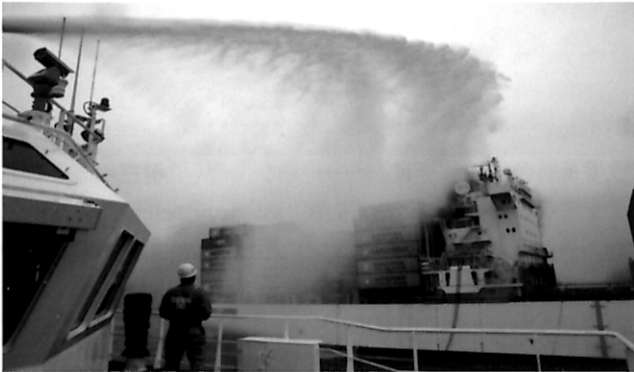
约见航海界 海上擒“火龙”