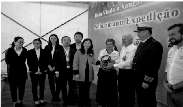
学会之窗 巴西帆船“东方之旅”抵沪 学会老少冒风雨欢迎航海世家