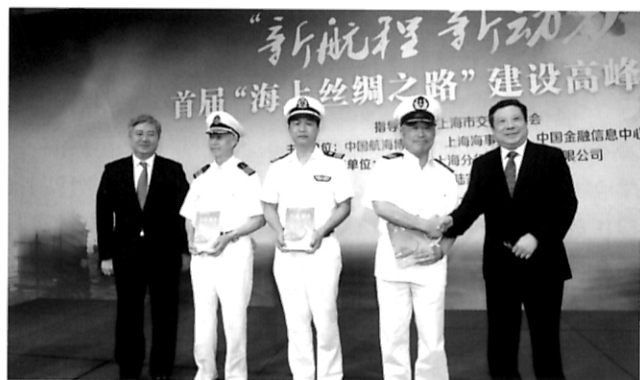
约见航海界 《上海船长》为“中国航海日”献礼