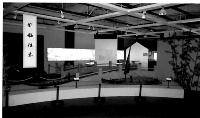
文化博览 古船汇长河 诗画两相宜