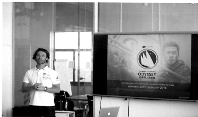
约见航海界 2017巴黎-上海无间断帆船长航“涛声起”