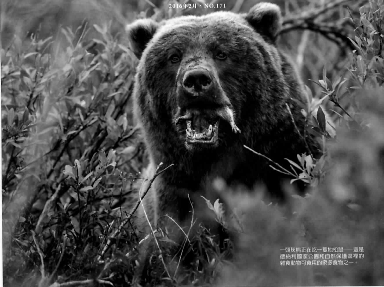
一頭灰熊正在吃一隻地松鼠——這是德納利國家公園和自然保護區裡的雜食動物可食用的眾多食物之一。