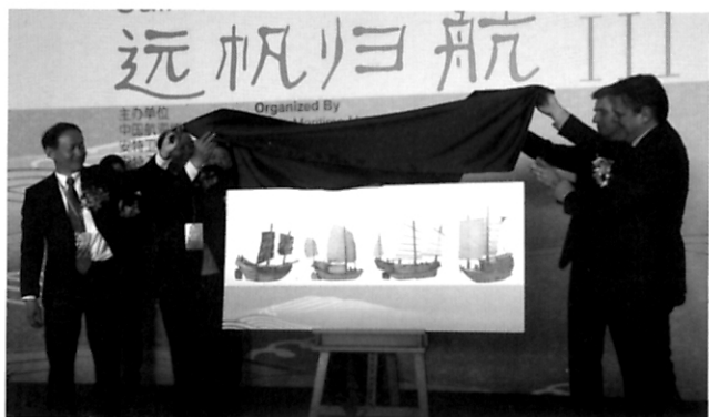
文化博览 承载百年世博情 远帆归航“上海港”