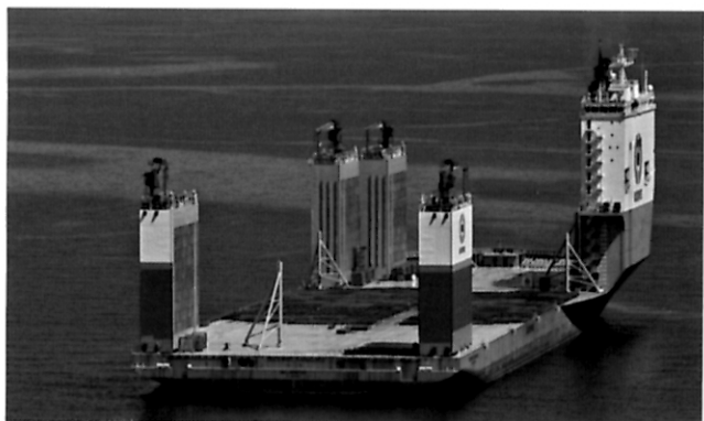
科普舱 半潜船的前世今生