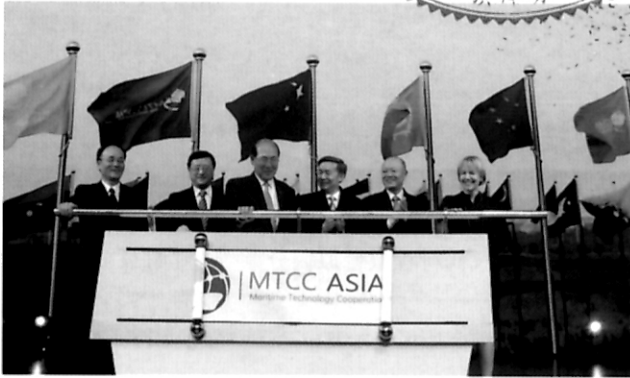
约见航海界 上海国际海事亚洲技术合作中心成立