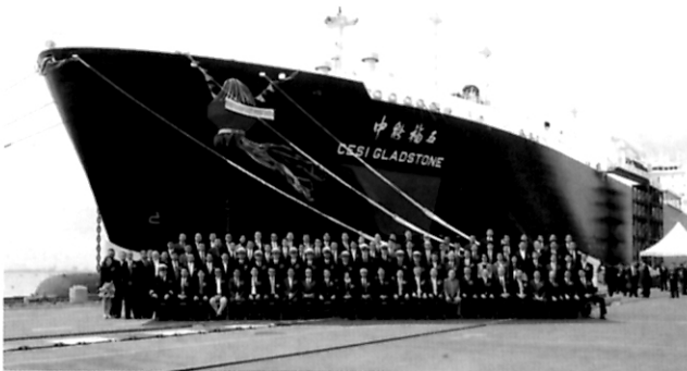
约见航海界 十年磨一剑 霜刃闪光华