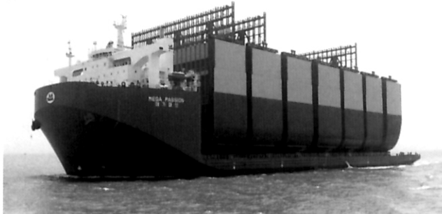
航海技术 5万吨级半潜船靠离大宇码头引航操纵方法及要点