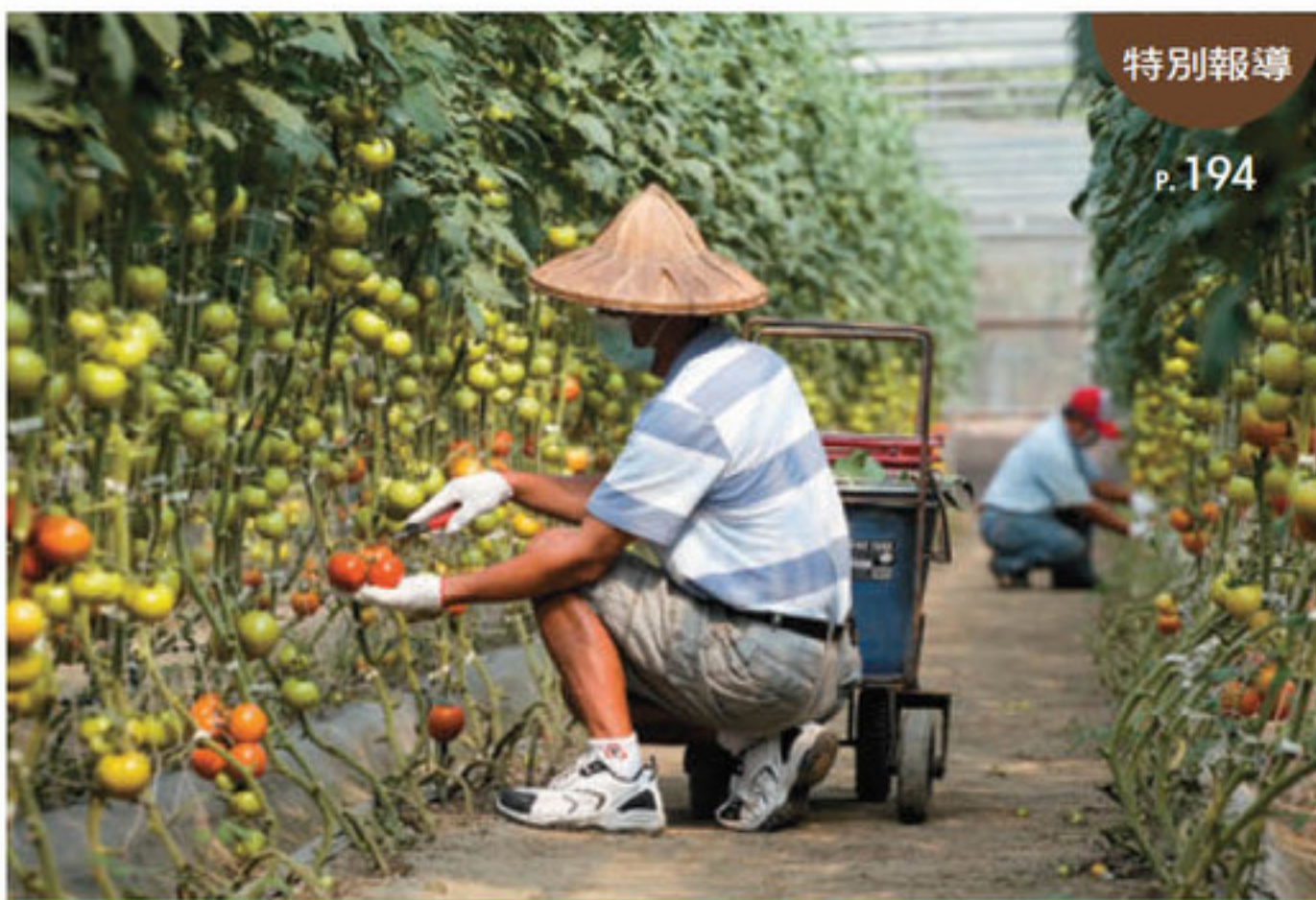
特別報導 p. 194