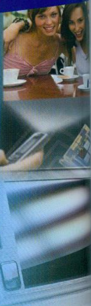
封面圖片來源：PhotoXpress - 台灣海峽資訊