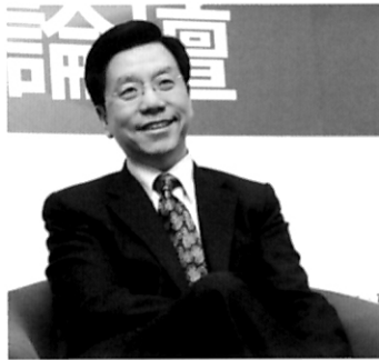
106 他為什麼是華人第一