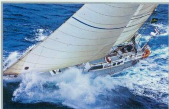
↑ 128.悉尼至霍巴特帆船赛完美收官 ↓ 156.航海女杰——Dee Caffari (上)