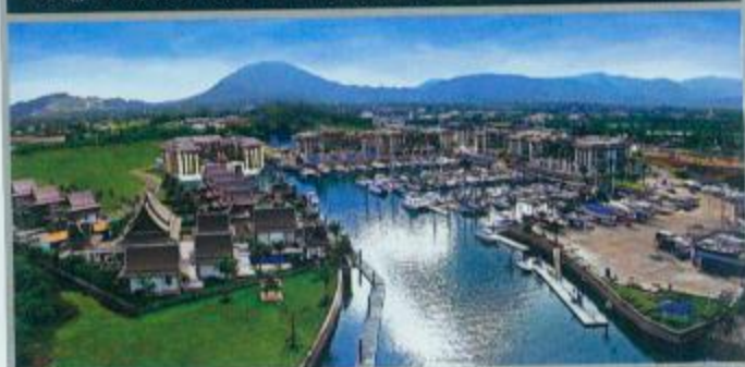
84. 普吉岛游艇展收获成功