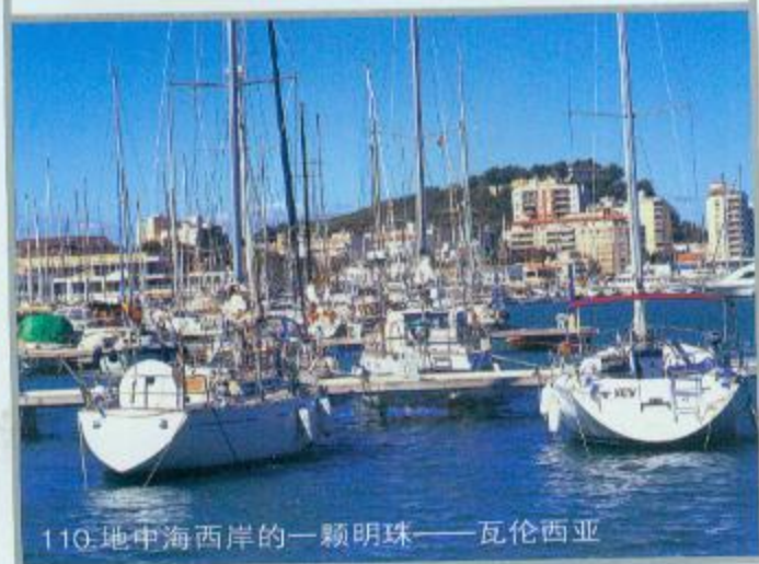
110. 地中海西岸的一颗明珠——瓦伦西亚