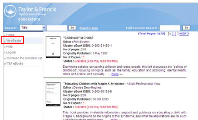
瀏覽所有電子書書目